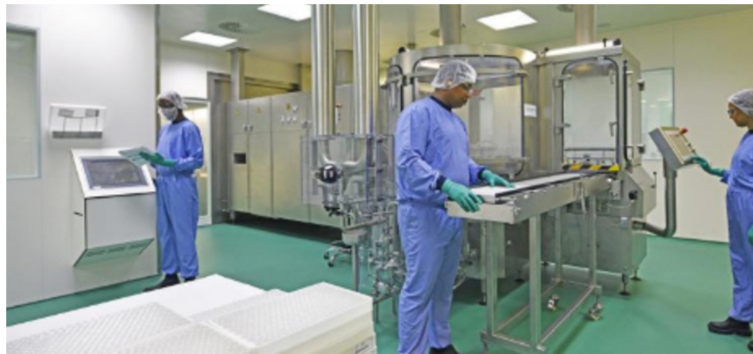
Collega's van PharmOps...

Een bijzondere uitdaging hadden we bij de productie van Esmeron. Dit is een spierverslapper die normaal gesproken in ziekenhuizen gebruikt wordt bij operaties, maar nu vooral gebruikt wordt om beademing van coronapatiënten te vergemakkelijken. De vraag ernaar groeide enorm, maar we konden 'm bijbenen. Niet alleen dankzij de inzet van collega's op Moleneind: operators van De Geer en zelfs uit Boxmeer boden zich aan om te komen helpen. Een prachtig voorbeeld van hoe we als één bedrijf deze crisis te lijf gaan!