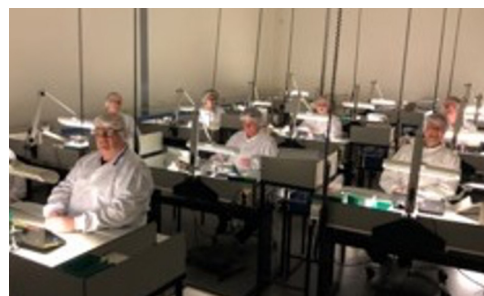
...collega's uit Boxmeer...