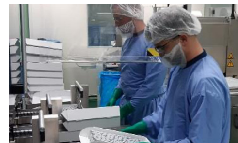
... en van De Geer helpen met de productie van Esmeron